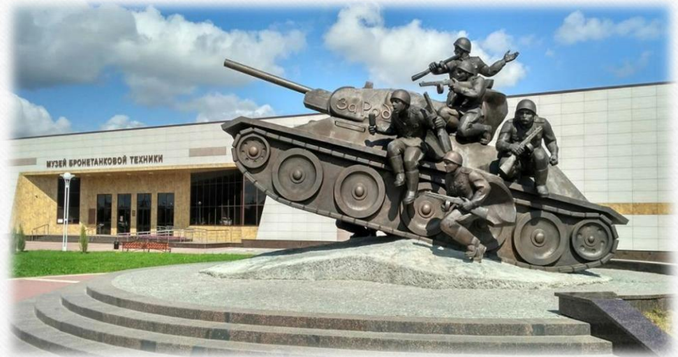
Музей бронетанковой техники