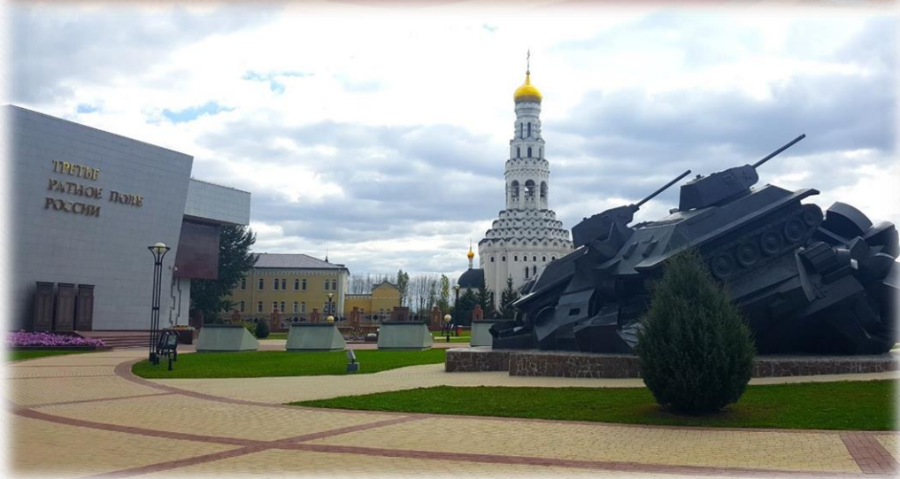
Музей «Третье ратное поле России»